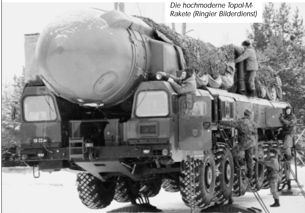
Die hochmoderne Topol-M-Rakete

tet fort, und man ist im Westen bereits seit längerem sehr sicher, dass sie fortan das Schwergewicht der militärischen Anstrengungen Moskaus darstellen werden. Bisher verfügt das erste Raketen-Regiment in der Stadt Tatischschwo (bei Saratow, an der Wolga) nur über zehn dieser neuen «Topol-M»-Raketen; die gleiche Anzahl soll sie die nächsten Monate erhalten und ab dem Jahr 2000 dann alljährlich 40 bis 45 Stück. Werden sie doch ganz offen als «die Waffe des 21. Jahrhunderts» genannt, wobei überstolz zu «Topol-M» betont wird: «In weniger als einer hal-